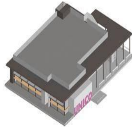
外部增加回廊及调整楼梯位置 Add clusters and adjust stairs