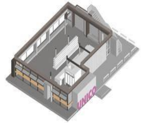
室内增加大面积观景窗使室内外一体化 Add large windows to the interior